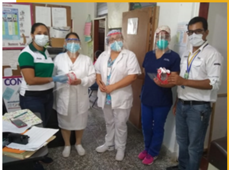
ENTREGA A CESAMO DE CONCEPCIÓN DEL SUR, S. B