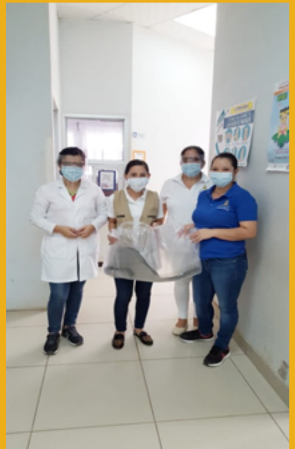
ENTREGA A RED DESCENTRALIZADA DE SALUD ATIMA, S. B