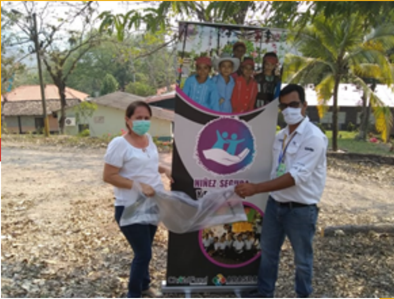
ENTREGA A CESAMO DE ZACAPA, S. B