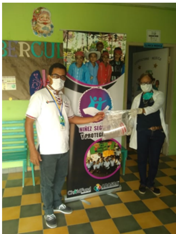
ENTREGA A CESAMO DE GUALALA, S. B