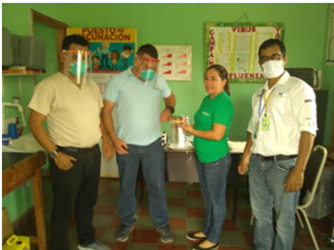
ENTREGA A CESAMO DE SAN FRANCISCO DE OJUERA, S. B