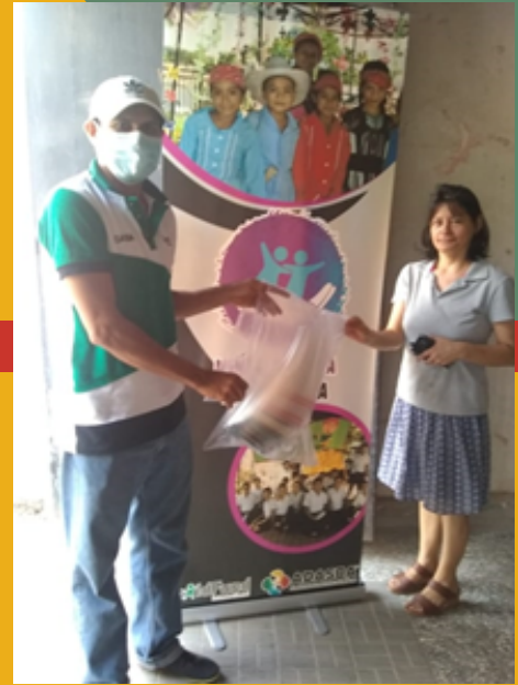
ENTREGA A CESAMO DE SAN NICOLÁS, S. B