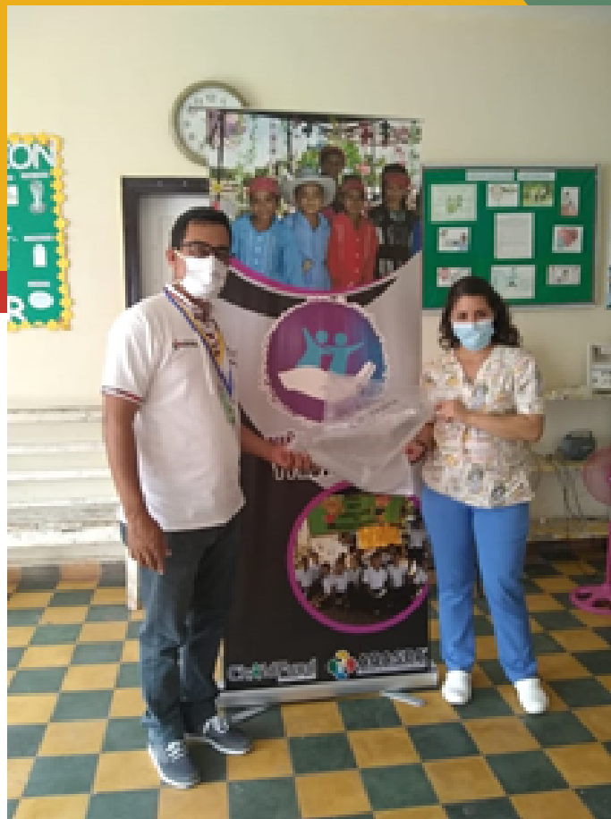
ENTREGA A CESAMO DE EL NÍSPERO, S. B