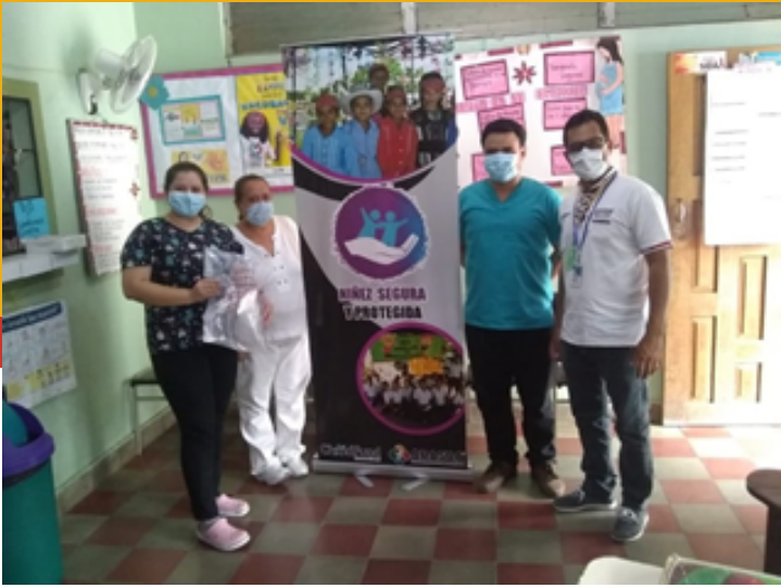
ENTREGA A CESAMO DE SAN VICENTE CENTENARIO, S. B