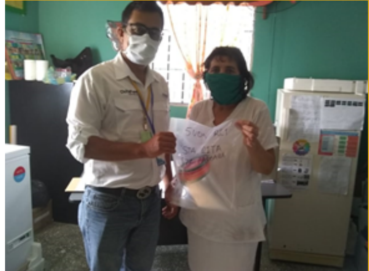
ENTREGA A CESAMO DE SANTA RITA, S. B