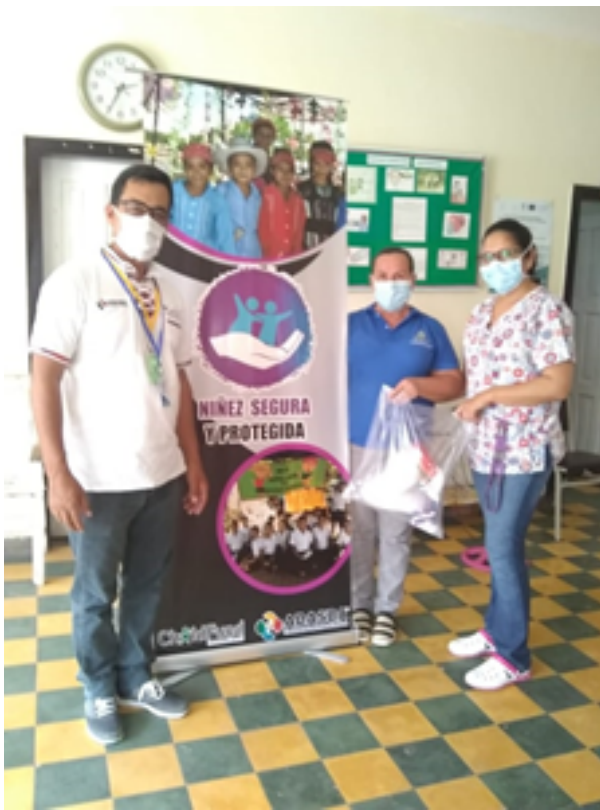
ENTREGA A CESAMO DE ARADA, S. B