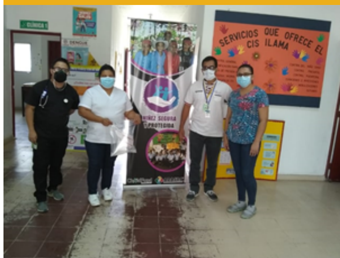
ENTREGA A CESAMO DE LIAMA, S. B