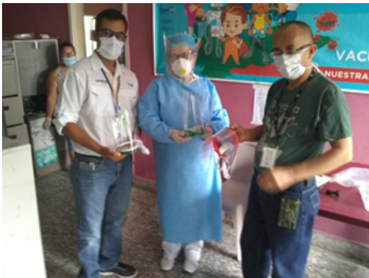
ENTREGA A CESAMO DE CEGUACA, S. B